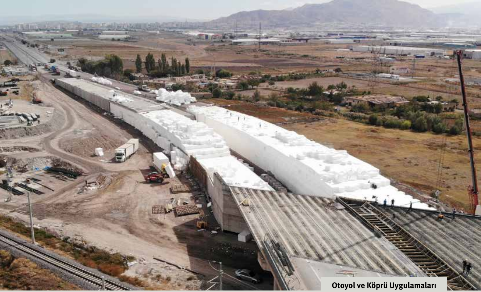
Otoyol ve Köprü Uygulamaları